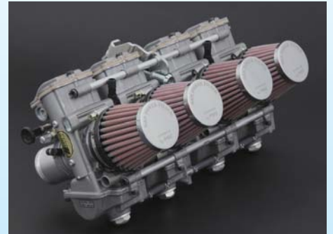
パワーフィルター仕様はフィルターのトップキャップおよびコットンの色をSSSエアストリームシリーズの計8タイプのパリエーションからお選び頂けます。次ページ下段のカラーコード表よりご希望のフィルターのカラーコード(1~8)をご記入下さい。