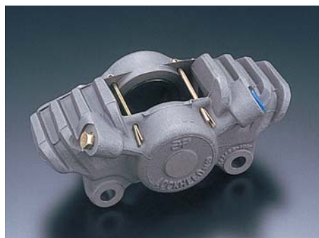
ツープイス2ピストン

AP RACINGにラインナップされるキャリパーは、すべてがレーシングスペックで、それぞれの時代の最先端の技術が、その製品に惜しみなく注入されています。1980年代のワークススーパーバイクに数多く採用されたキャストボディのモデルは、現在でもチューニングバイクを確実にストップさせる性能を誇っており、サンデーレースなどで主流となっています。鍛造削りだしボディの6POTキャリパーやラジアルマウントの4POTキャリパーは、そのままGPやWSBで使用可能なハイスペックバージョンで、カーボンディスクの使用さえ可能とします。