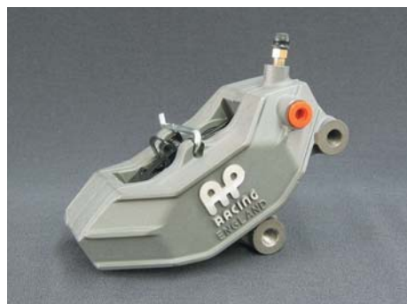
ツープイス4ピストン