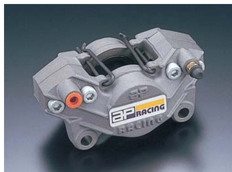
ツープイス2ピストン